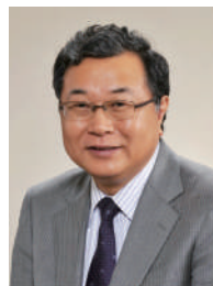
一般社団法人 ステキ信頼リフォーム 推進協会

こうした課題に対応すべく、私どもは、良好な住宅リフォームの推進を通じ、住宅リフォーム事業の健全な発展及び消費者が安心してリフォームを行うことができる環境の整備を図るために、リフォーム関連事業者等が主体となった「一般社団法人 ステキ信頼リフォーム推進協会」を設立いたしました。私ども「一般社団法人 ステキ信頼リフォーム推進協会」は、継続的な情報取得と自己研鑽に努めるとともに、住宅リフォームを取り巻く環境を整備し、消費者・リフォーム事業者の双方にとって有益かつ健全なリフォーム市場及び既存住宅流通市場の形成・発展に邁進してま